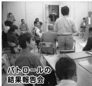
パトロールの 結果報告会