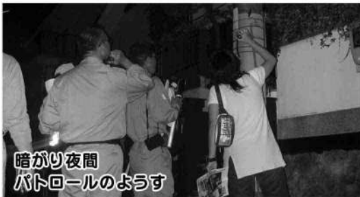
暗がり夜間 パトロールのようす