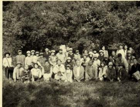
ウォーキング時の集合写真

また、旗振山登山道一帯の豊かな自然環境と開発に不適な地形に接し、改めてその保全の必要性を確認しました。地域を知り、お互いの交流を深める良い機会であることから、自然環境保全検討委員会では、今後同様のイベントを継続して行うよう提案しています。