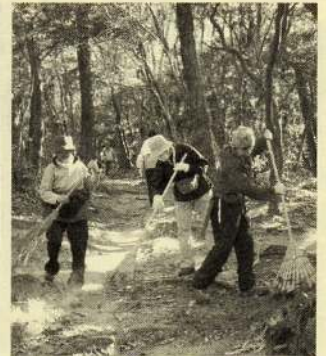
旗振山登山道の清掃風景

12月12日には、塩屋の自然を守る会・市民山の会との共催で、旗振山登山道の清掃を行いました。今回は、若い人も含めた25名以上の参加者により、主に落ち葉と不法投棄された不燃ゴミの回収を行いました。また、一部倒木の危険性のある枯木の伐採も行っています。今年以降は、3月・6月・12月と、年3回の登山道清掃、および補修の実施を予定しています。